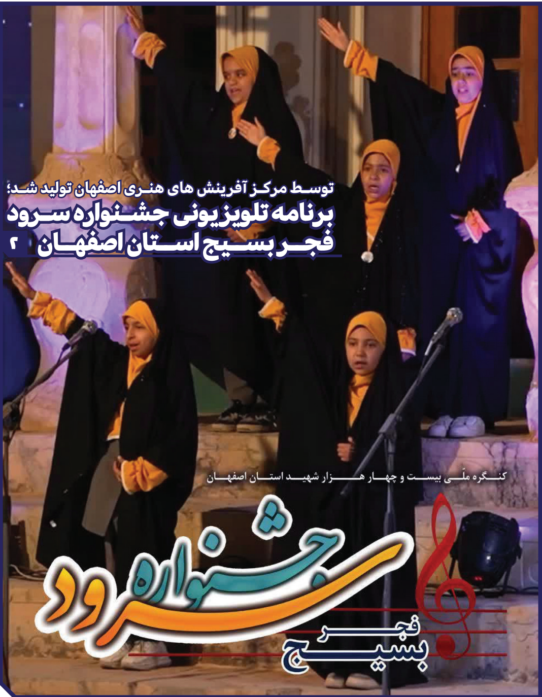
کنگره ملی بیست و چهار هزار شهید استان اصفهان

برگزاری «تربیون آزاد» توسط مرکز تهران بزرگ ۸